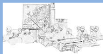
INSTITUTO HISTÓRICO DE CASTILLA-LA MANCHA